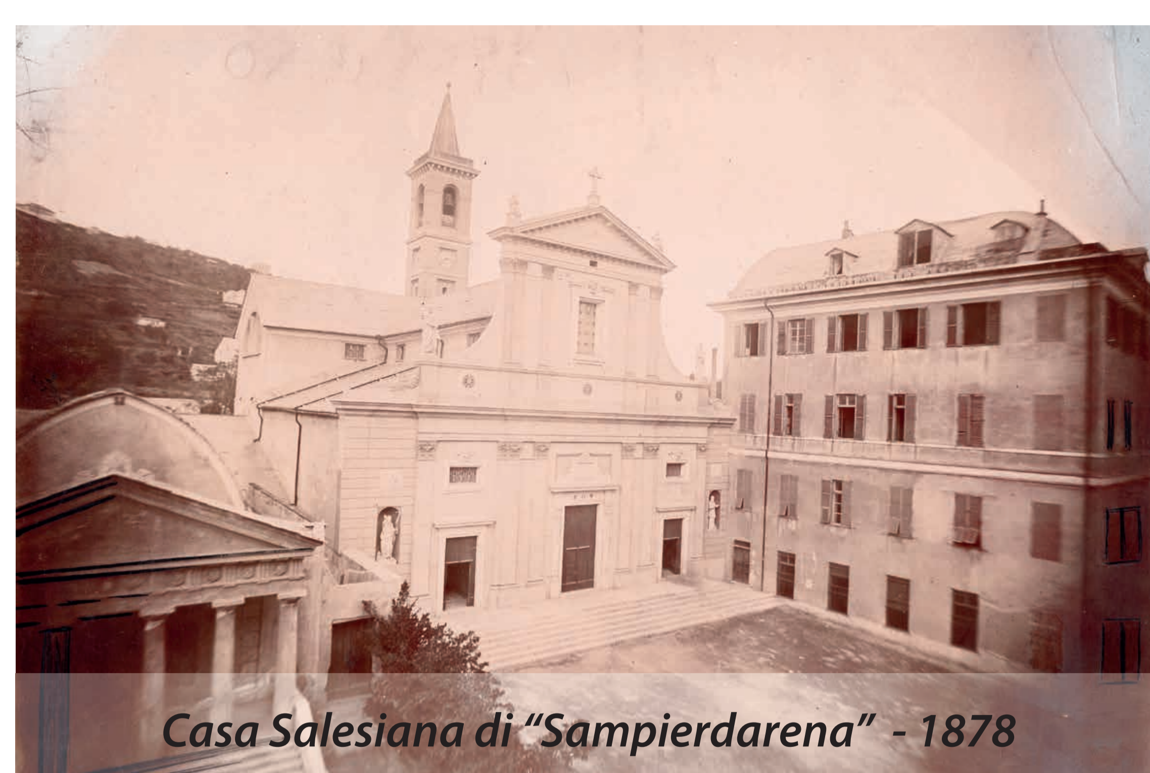
Casa Salesiana di "Sampierdarena" - 1878