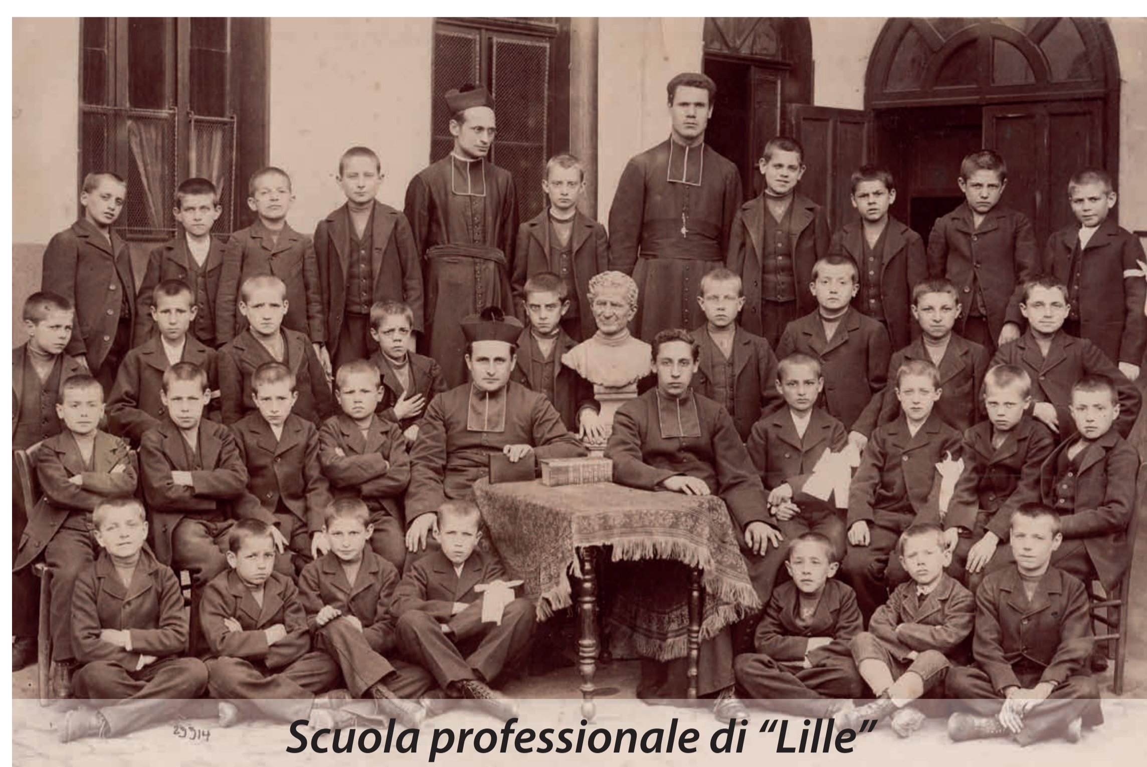
Scuola professionale di "Lille"

Dalla testimonianza di un ragazzino su don Albera: "Fui grandemente edificato del contegno modesto ed umile del nostro superiore, del suo costante sorriso che incoraggiava, e delle sue maniere dolci, amabili che attiravano. Non vi era ricreazione in cui non comparisse fra noi; ma anche negli altri luoghi veniva a visitarci, specialmente in refettorio e in cappella. Parlava poco, ma la sua presenza bastava a renderci rispettosi..."