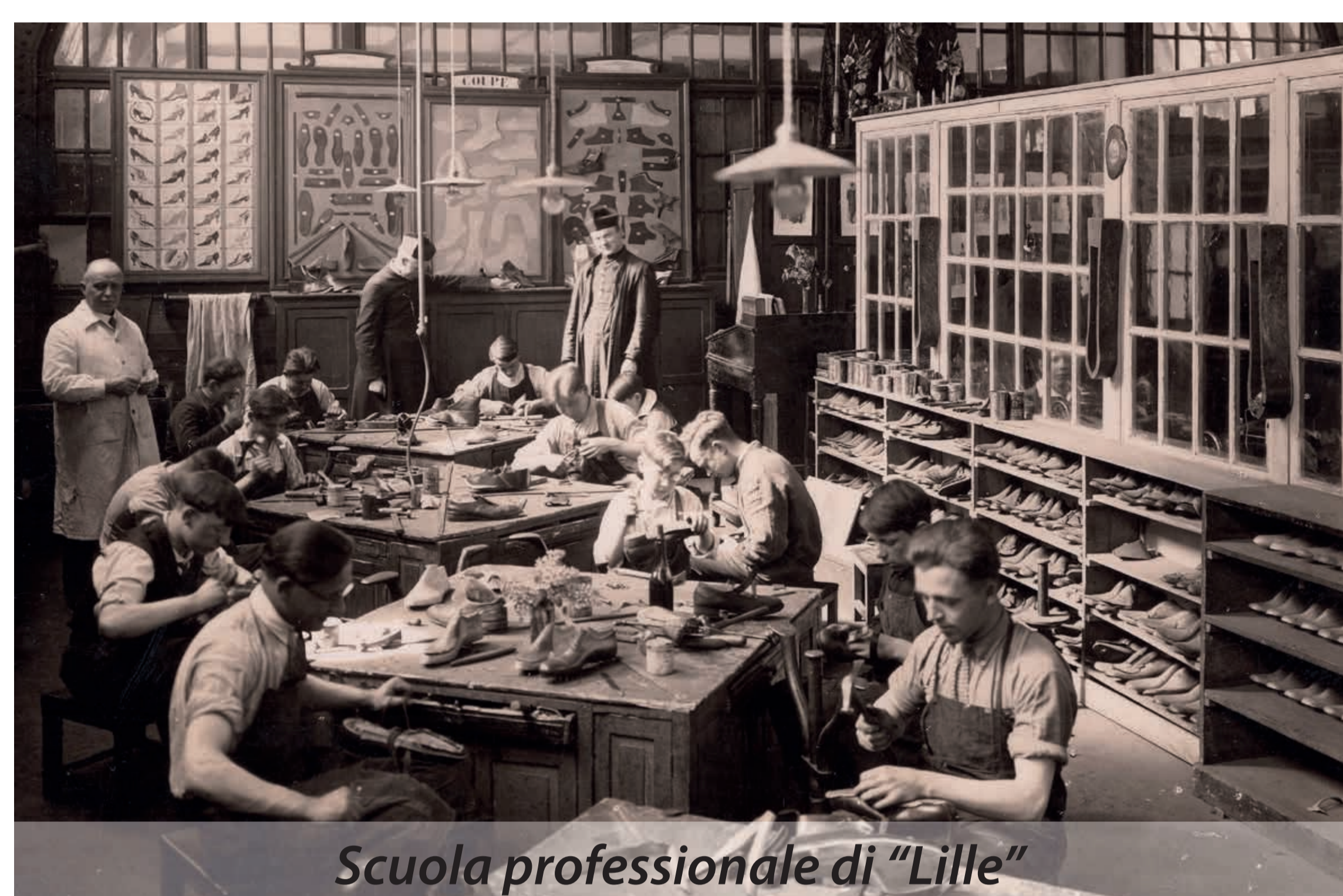
Scuola professionale di "Lille"