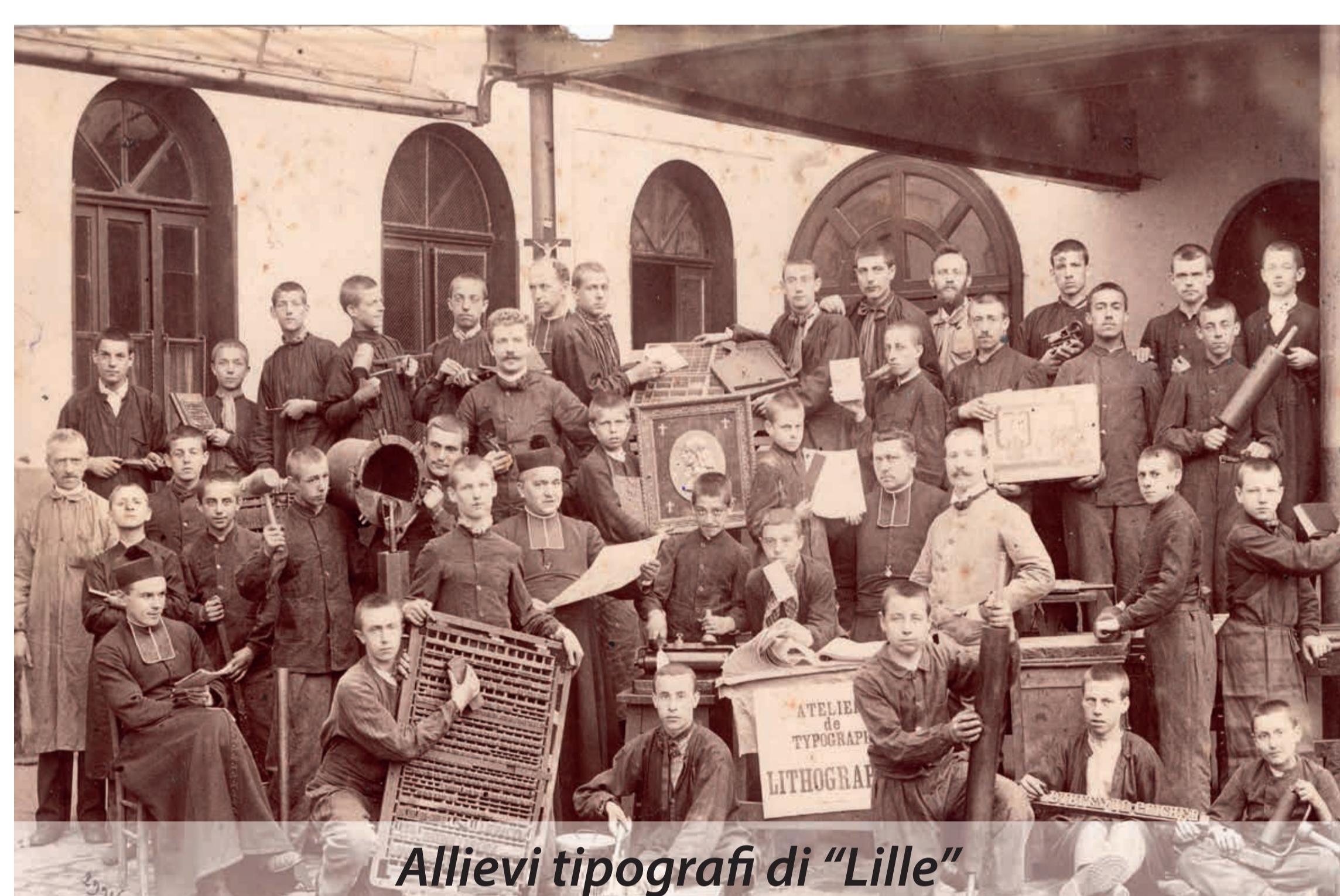
Allievi tipografi di "Lille"