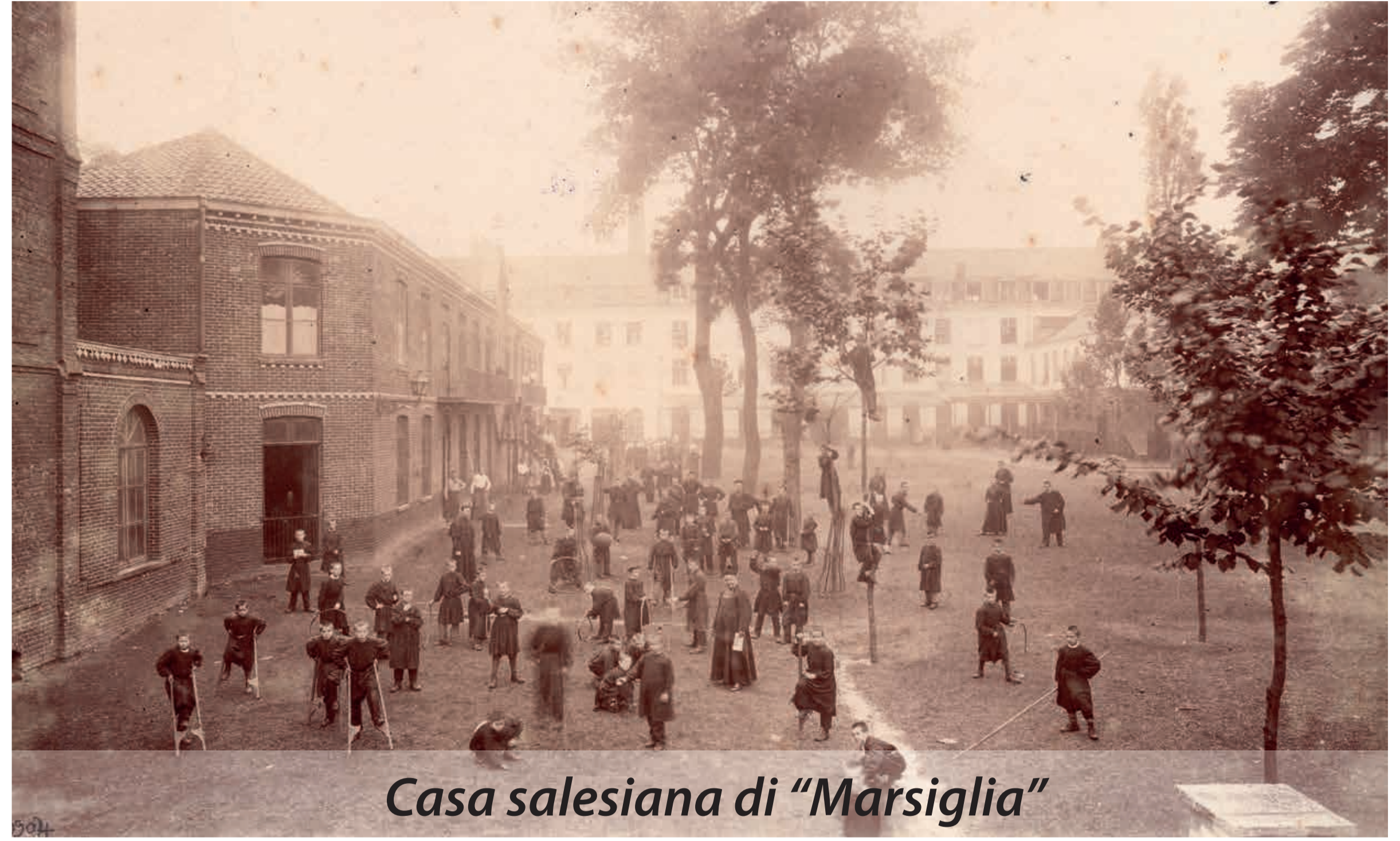
Casa salesiana di "Marsiglia"