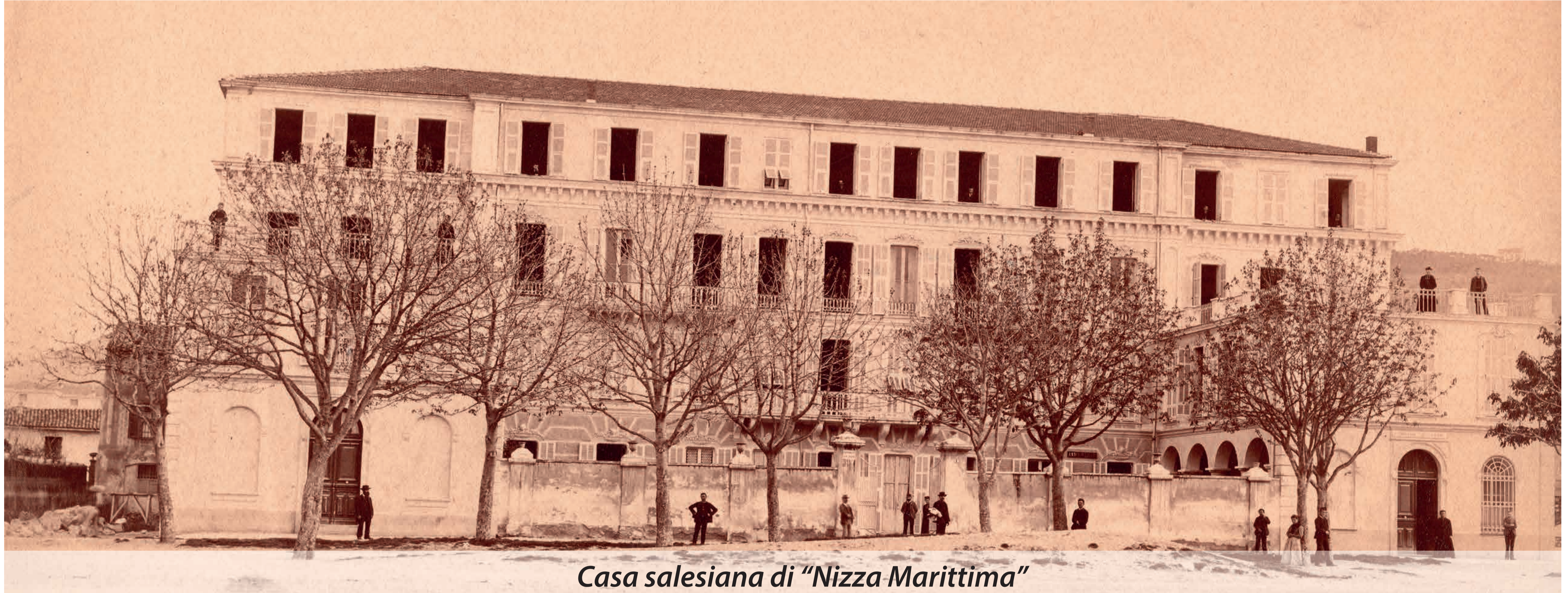
Casa salesiana di "Nizza Marittima"