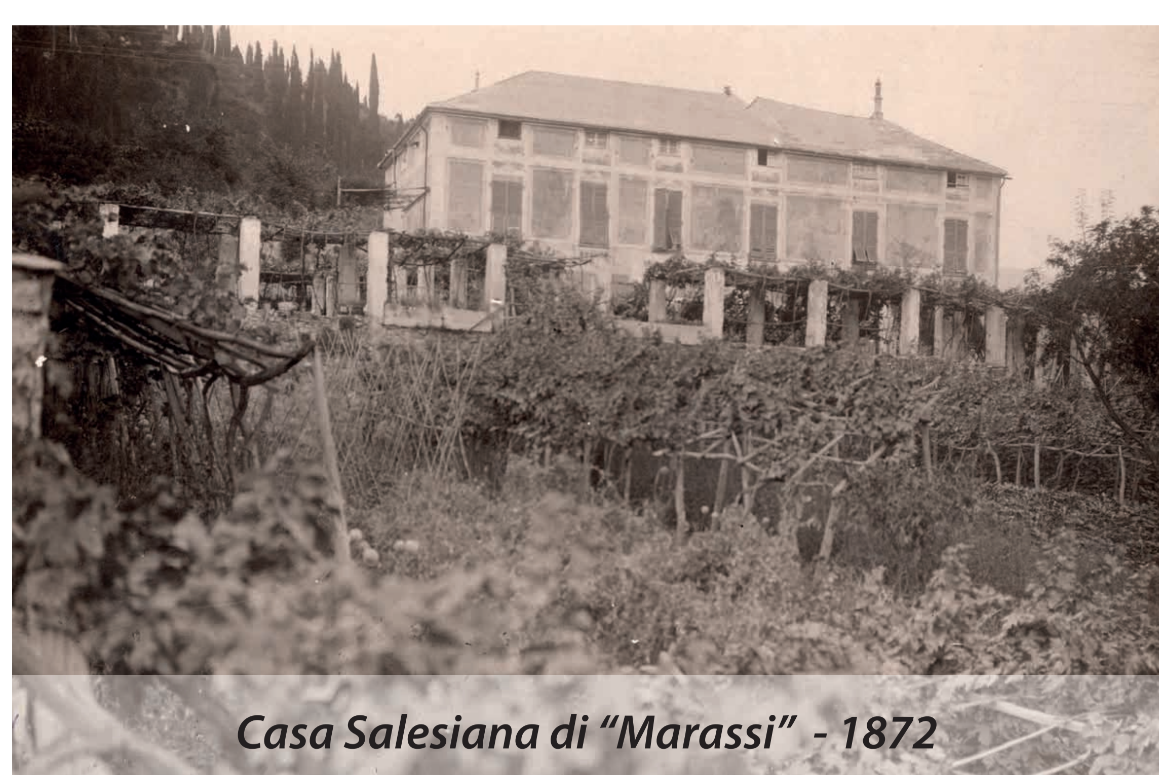
Casa Salesiana di "Marassi" - 1872