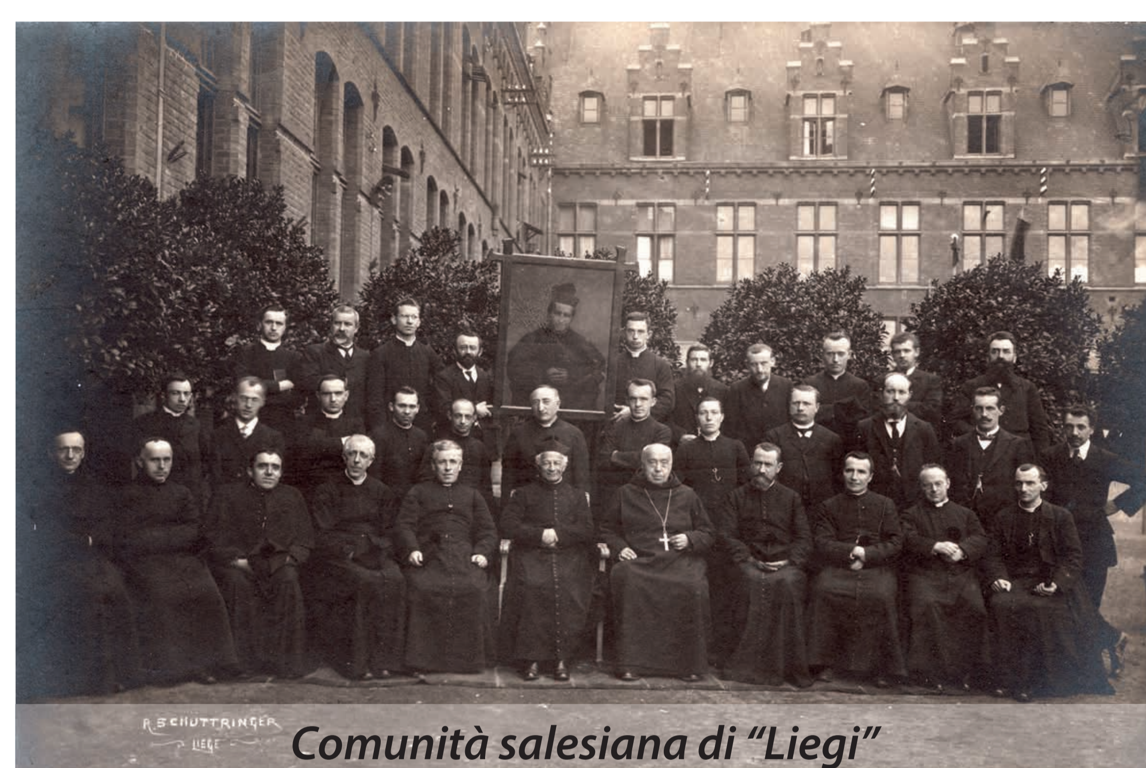
Comunità salesiana di "Liegi"