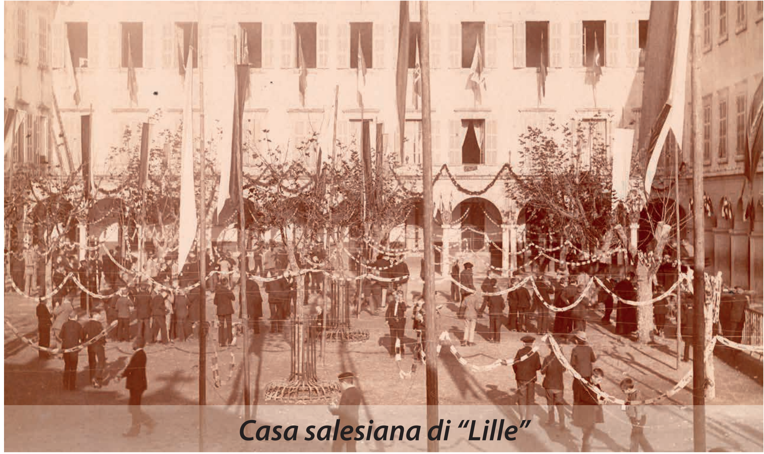
Casa salesiana di "Lille"