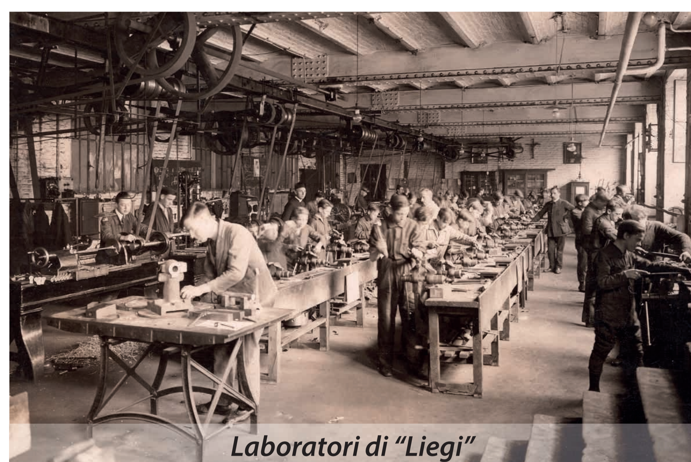
Laboratori di "Liegi"