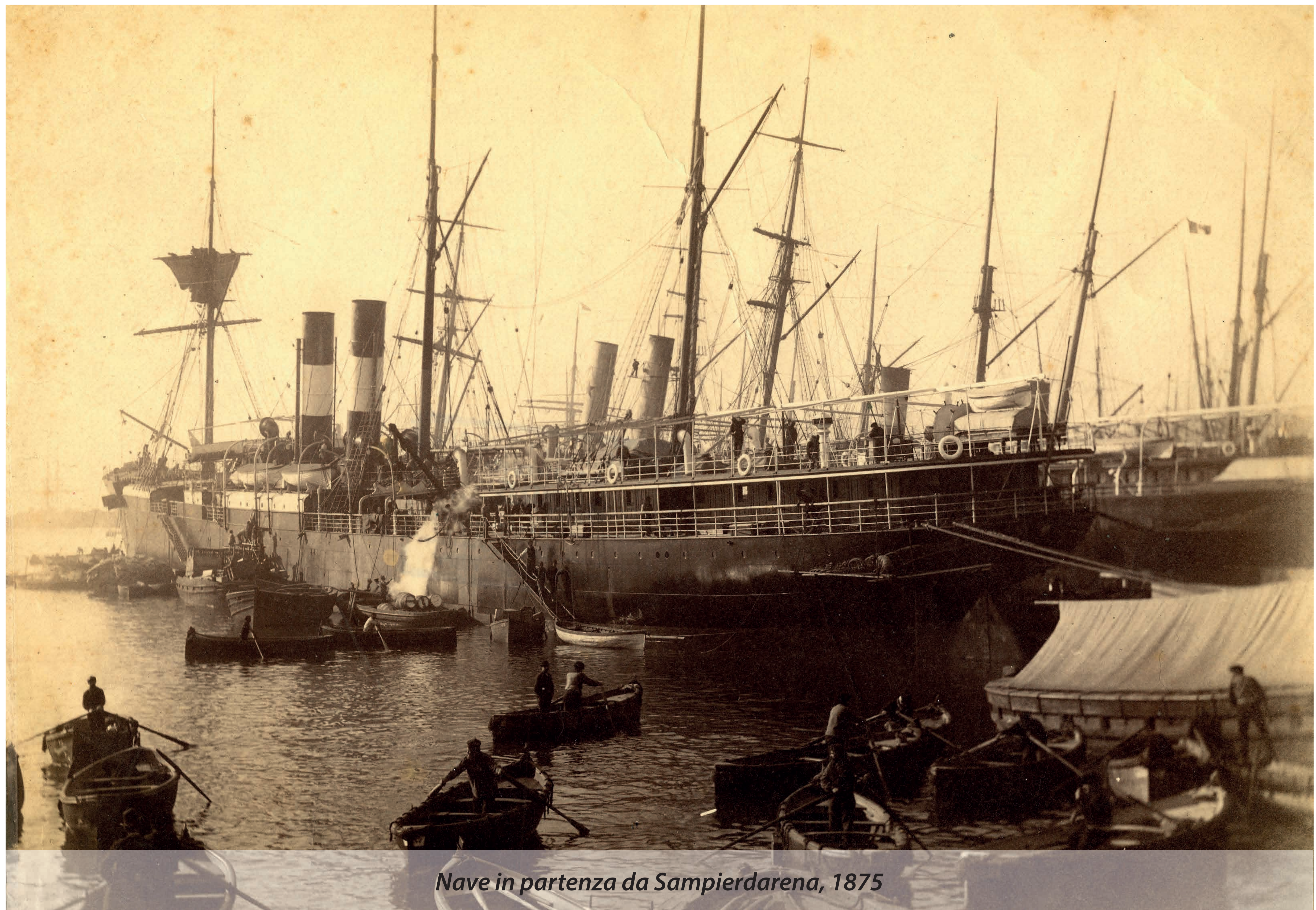
Nave in partenza da Sampierdarena, 1875